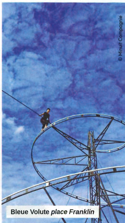
Bleue Volute place Franklin