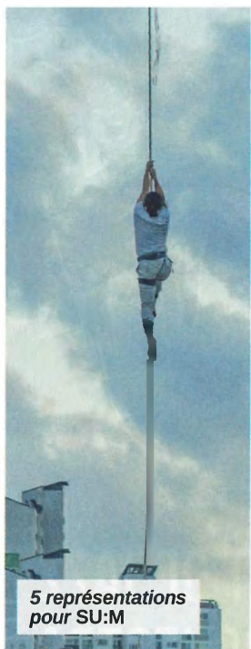
5 représentations pour SU:M